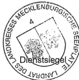
Seiferth Amtsleiter Kreisrechtsdirektor

Regionalstandort Neubrandenburg Platanenstraße 43 17033 Neubrandenburg Telefon: 0395 57087 0 Fax: 0395 57087 5901