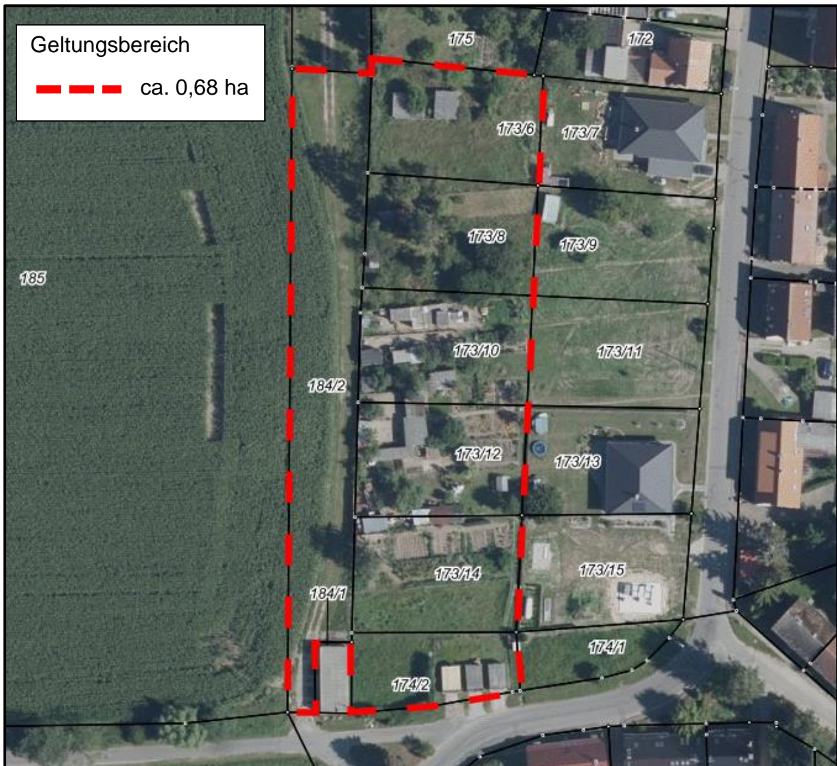
Bebauungsplan Nr. 1 „Wohngebiet Golchen“ der Gemeinde Golchen Ausgrenzung